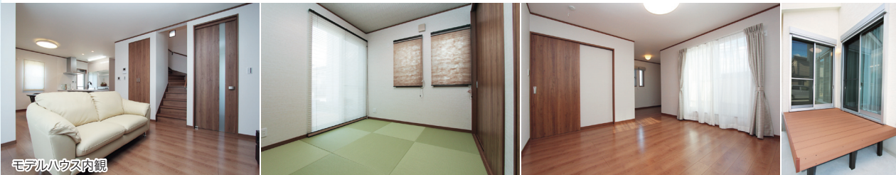
モデルハウス内観