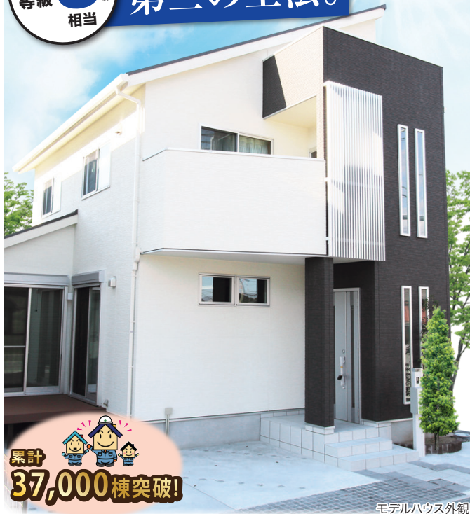
モデルハウス外観