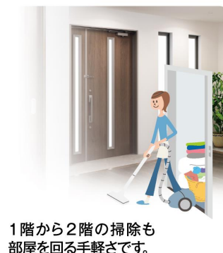
1階から2階の掃除も 部屋を回る手軽さです。

足腰が弱ると2階への移動が たいへんに。エレベーターが あれば平屋感覚で洗濯物や 買い物もラクに運べます。 階段での転倒などの危険も 減らせます。