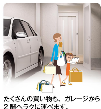
たくさんの買い物も、ガレージから 2階へラクに運べます。