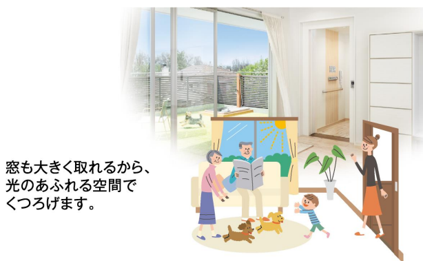
窓も大きく取れるから、 光のあふれる空間で くつろげます。

日当たりや風通しの良い2階はくつろぐのに ふさわしいスペース。集まって食事をしたり、 おしゃべりをして楽しめます。